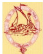
Asociación Cultural «Talia»