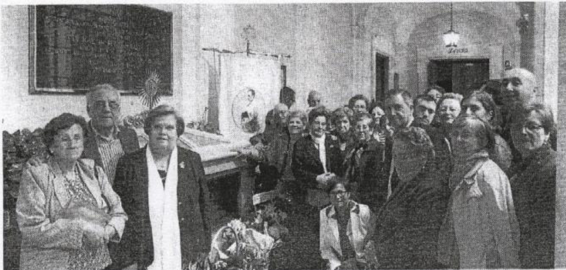
Los peregrinos de Dalías visitaron el sepulcro del padre Rubio cuando se cumplen 150 años de su nacimiento. :: IDEAL 10-11-14