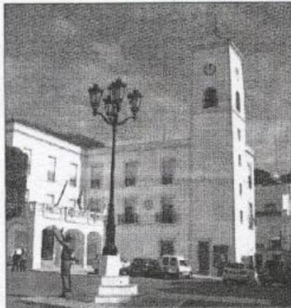
■ Ayuntamiento de Dalías.

También IU ha llevado el caso a los juzgados, ya que las obras "se pactaron sin ninguna formalidad" entre el alcalde y el representante de la empresa constructora