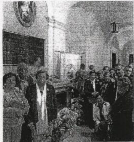
Los dalisenses visitaron el sepulcro del santo en Madrid.