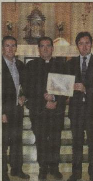
■ Presentación.

■■■ La Iglesia San Isidro Labrador acogió la presentación de 'Reflexiones y Testimonios', libro editado por la Hermandad de San José María Rubio y que recoge testimonios de 38 personas e instituciones que participan de su 150º Aniversario.